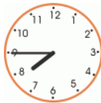
Las ocho menos quince, Ó las ocho menos cuarto